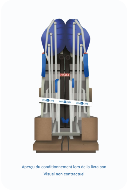
Aperçu du conditionnement lors de la livraison Visuel non contractuel