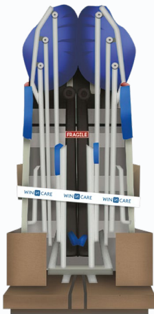
Aperçu du conditionnement lors de la livraison Visuel non contractuel