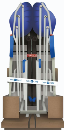
Aperçu du conditionnement lors de la livraison Visuel non contractuel